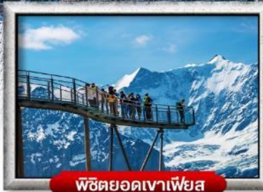
พิชิตยอดเขาเฟียส